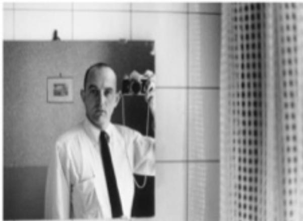
Duane Michals geb. 1932

Was fällt dir auf? Nimm Stellung zu: Licht, Blick, Stimmung und Accessoires/Körper.