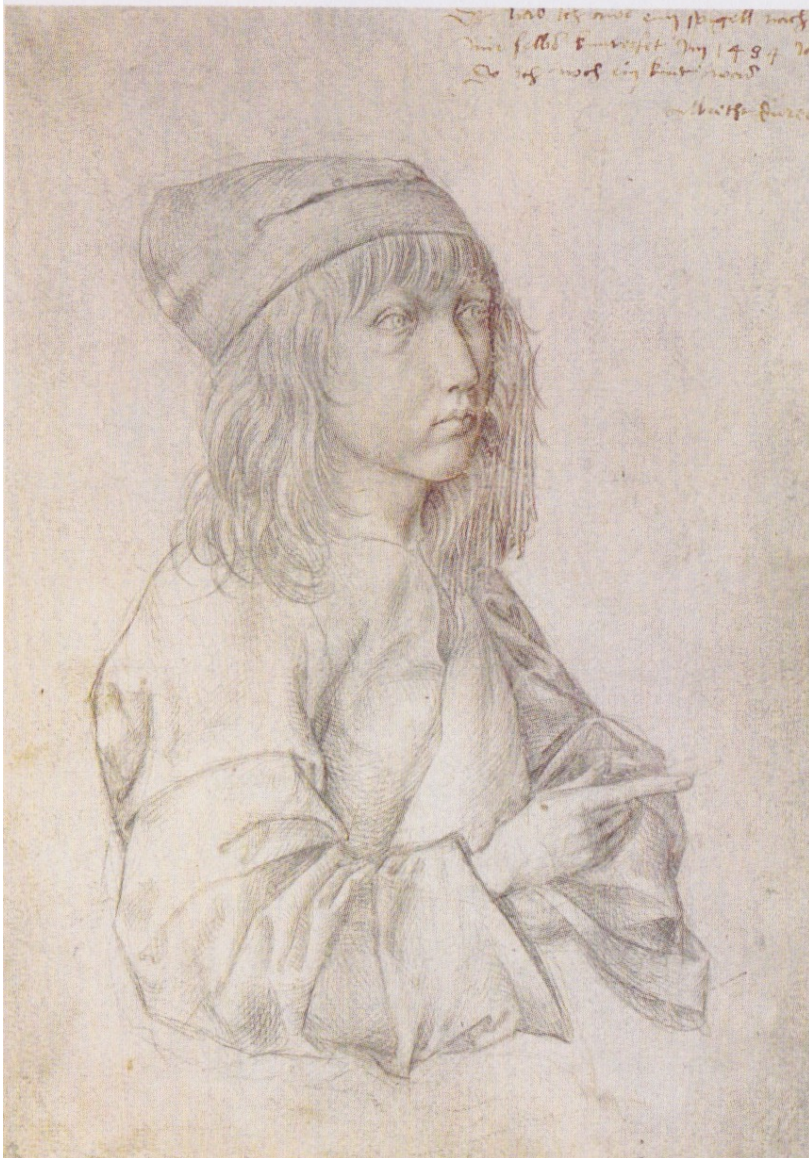
Albrecht Dürer, Selbstbildnis als Dreizehnjähriger, 1484