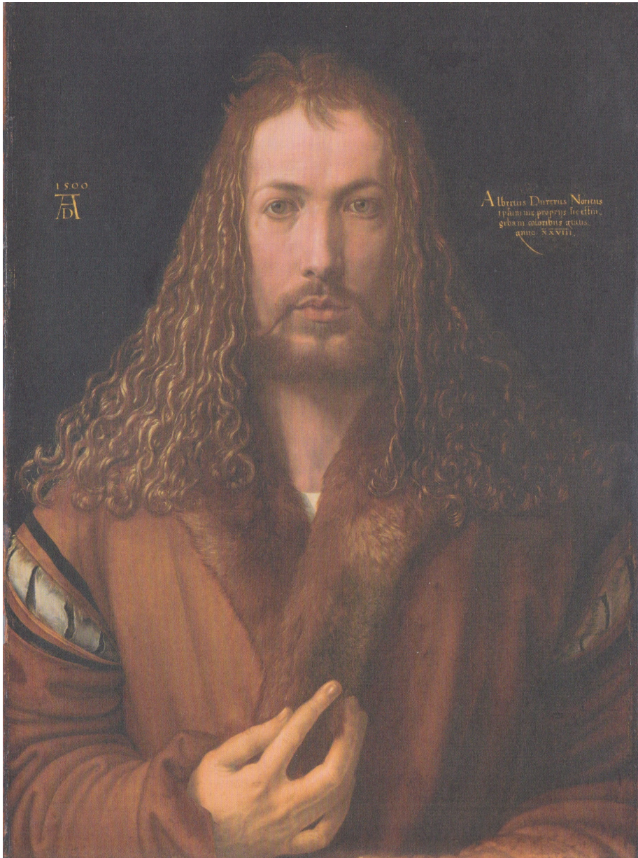
Albrecht Dürer, Selbstbildnis im Pelzrock , 1500